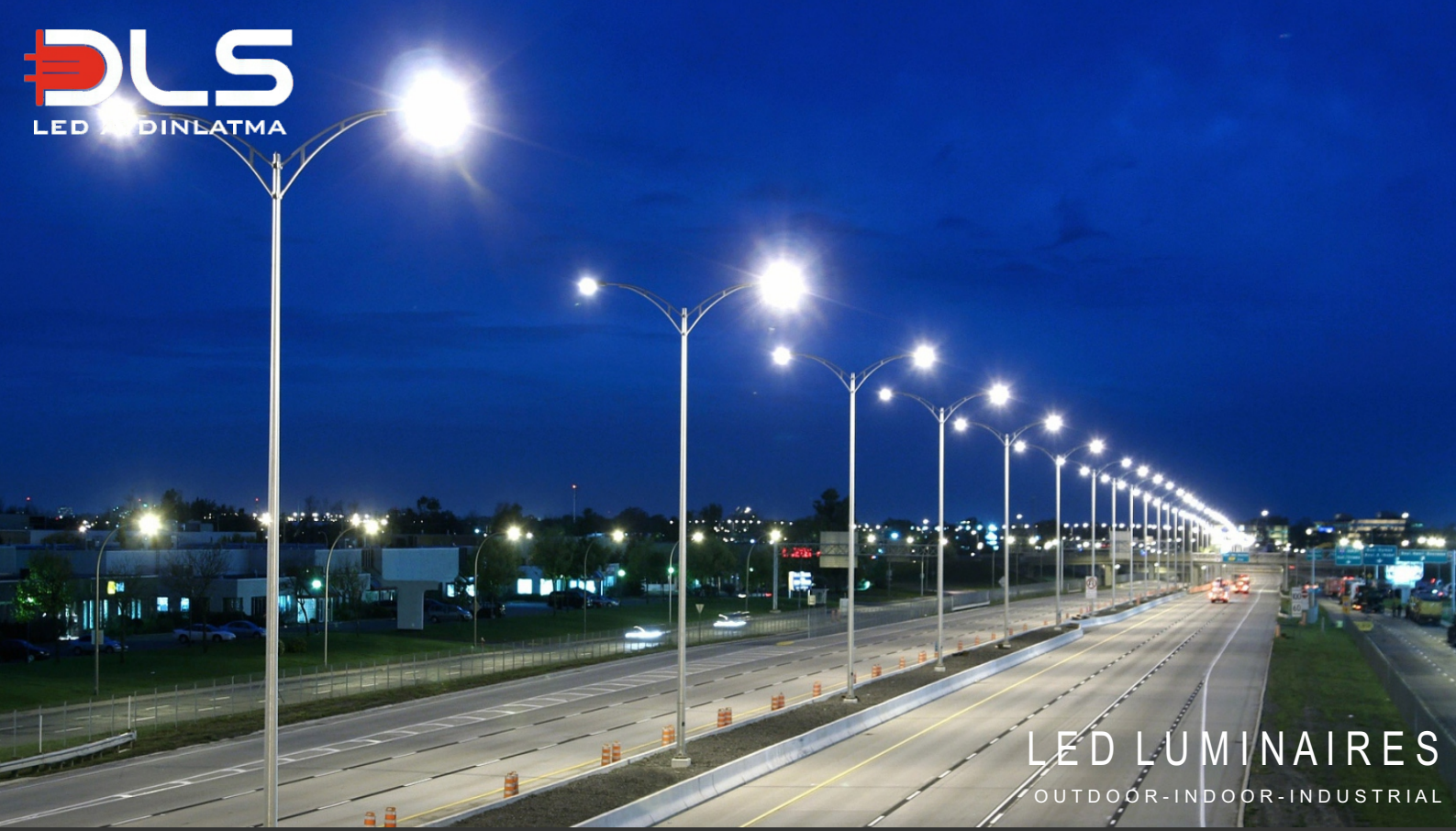
Led Street Light

LED LUMINAIRES OUTDOOR-INDOOR-INDUSTRIAL